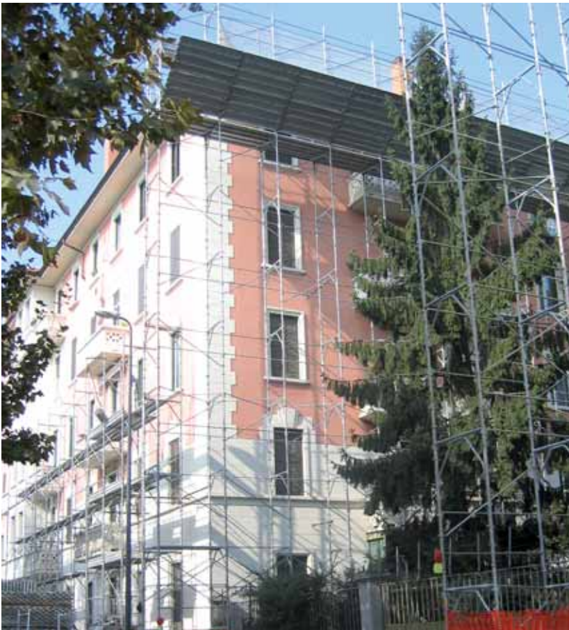
Ponteggi su via Borsi