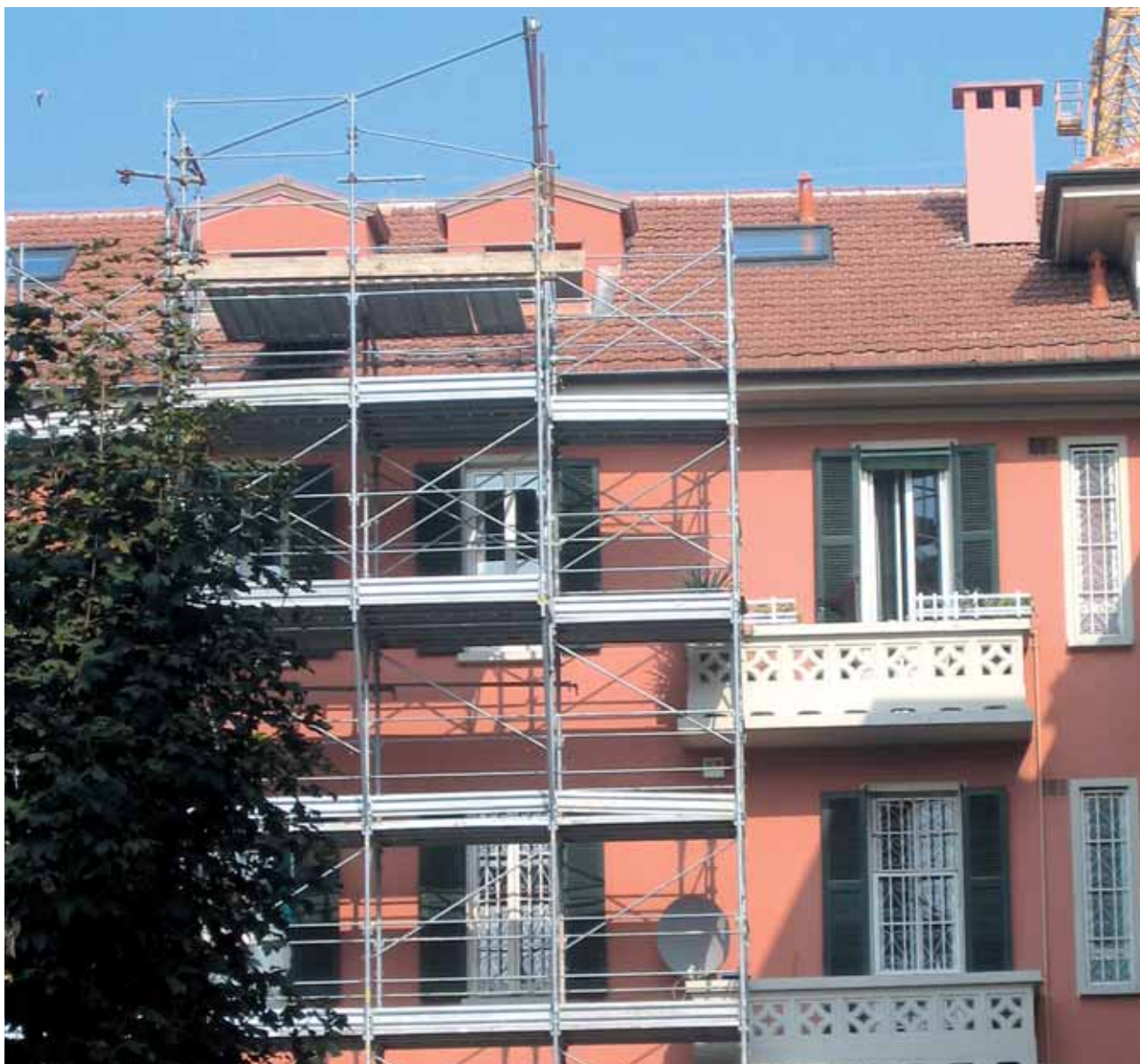
Vista dell'intervento in atto sull'edificio 4 di via Gola 27