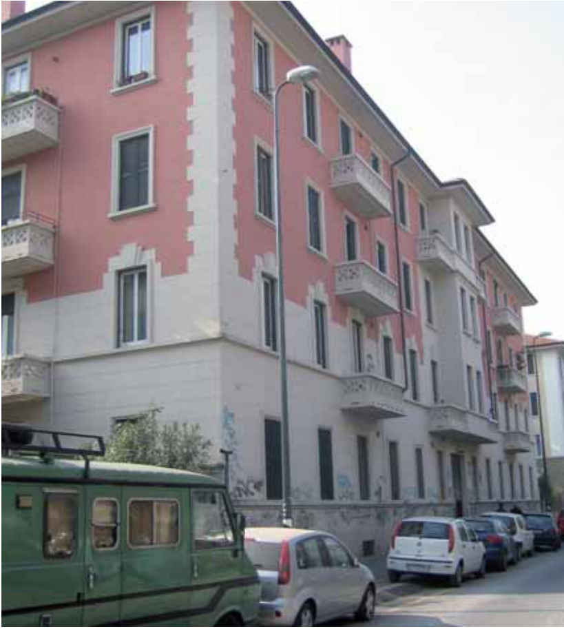
Vista fabbricato su via Gola